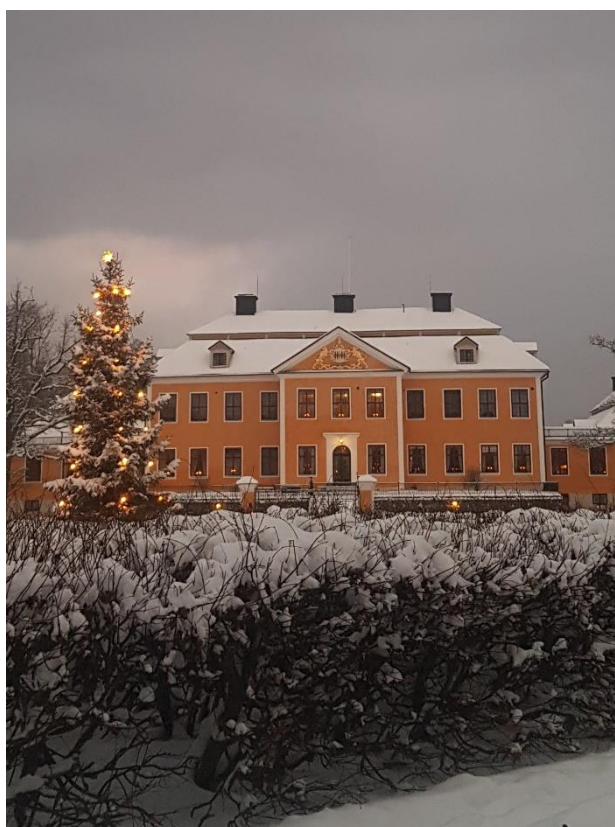
2a advent, Leufsta bruk, foto: Helén Olsson

En riktigt GOD JUL och ett GOTT NYTT 2022 önskar SSL,s styrelse Er Alla!